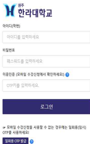
한라대학교 로그인 화면